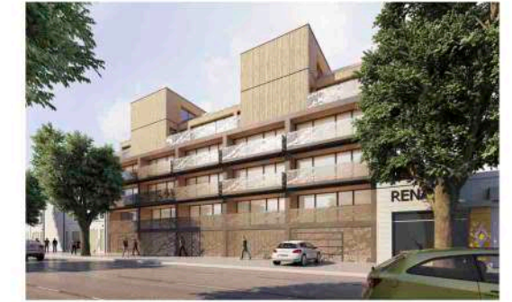
PLAN DE REPERAGE